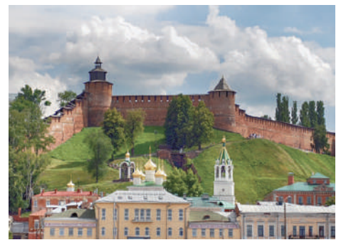
Нижегородский кремль, вид с Волги

По стенам кремля расположены 13 башен. У Ивановской башни внутри кремля находится Площадь народного единства, на которой стоит памятник Минину и Пожарскому – копия скульп-