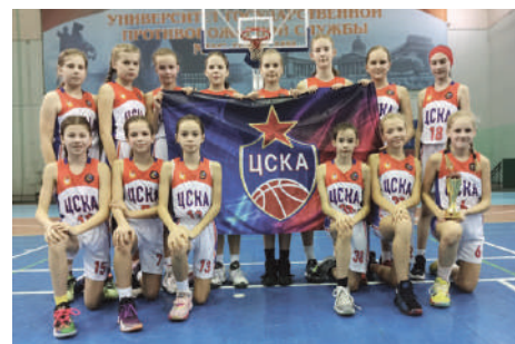
Спортсменки команды ЦСКА на турнире по баскетболу, Санкт Петербург