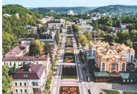
Центр г. Белогорска

Например, город Белогорск. (Прим. ред. - Белогорск — город в Амурской области России.) Здесь суровый климат, здесь живут очень дружелюбные и позитивные люди. Даже в лютый мороз они с лёгкостью и с улыбкой на лице