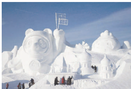
Фигуры из снега

ходят по улицам и, проходя мимо, обязательно приветствуют друг друга. Здесь, в Белогорске, много красивых зданий. Чего только стоит огромный кинотеатр и фонтан в центре города, а зимой здесь выстраивают громадные снежные фигуры различных персонажей и героев мультфильмов. Отличное место для проведения зимнего отпуска.