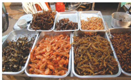
Креветки и другие морепродукты

Мы с мамой, приехав в Пхукет, (Прим. ред. - Пхукет - город в Таиланде, административный центр одноименной провинции в Таиланде), где полно тропических пляжей, скрытых храмов, местных экзотических рынков и шумных клубов, долго думали, на какой из островов нам отправиться на экскурсию, и выбрали острова «Пхи-Пхи». (Прим. ред. - Острова Пхи-Пхи (Phi-Phi Islands) - райский уголок Таиланда). Совершенно прозрачная, чистая вода, белоснежные пляжи, восхитительные