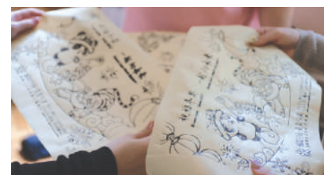
На уроке китайского языка

После экскурсии по зданию мы прослушали лекцию о языке жестов. Студенты университета рассказали нам о том, как глухие люди адаптируются в жизни, как общаются друг с другом и с окружающим миром. Для нас было откровением узнать, что неслышащие люди могут водить машину, и делают это даже лучше людей, которые могут слышать! Мы узнали, что у глухих родителей в 90% случаев не рождаются глухие дети. В завершении лекции на электронной доске нам показали алфавит