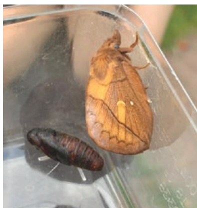
Бабочка в коробочке

Ребята, это так интересно – отвечать на свои «почему?» через собственные наблюдения, исследования, открывать загадки мира самостоятельно!