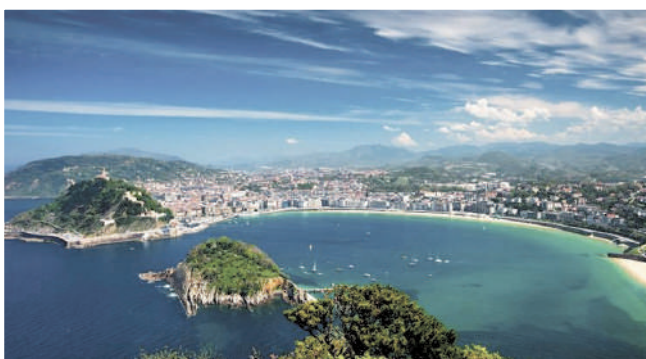
Город Сан_Себастьян и пляж Ла-Конча

Береговая линия Сан-Себастьяна прерывается горами, образуя пляжи в виде