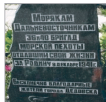
Памятник морякам-дальневосточникам, сражавшимся под Москвой зимой 1941 года