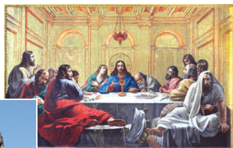
Мозаика «Тайная вечеря»