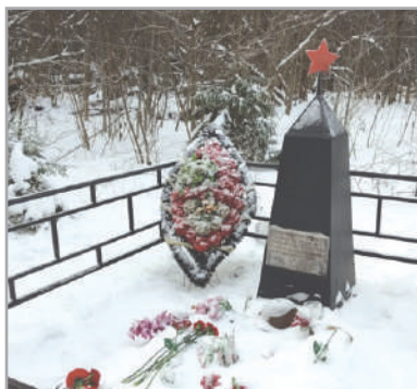
Братская могила двенадцати неизвестных солдат

Затем все отправились к памятнику морякам-дальневосточникам, сражавшимся здесь зимой 1941 года. Этот памятник на Рождественском поле у леса, между селом Рождествено и Дедовском, к 60-летию битвы под Москвой в 2001 году установили, как на нем написано, «бесконечно благодарные