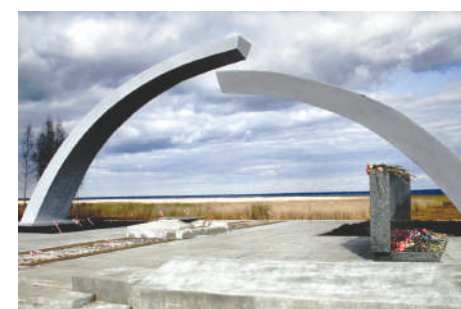
Памятник «Разорванное кольцо» Зеленого пояса славы защитников Ленинграда.

И хотя ширина коридора, связавшего город со страной, была всего 8-11 километров, политическое, материально-экономическое и символическое значение прорыва блокады невозможно переоценить. В кратчайшие сроки были построены железнодорожная линия Поляны-Шлиссельбург, автомобильная магистраль и несколько мостов через Неву.