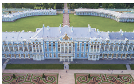
Екатерининский дворец-музей в г.Пушкин

Мы совершили поездку и в пригород Санкт-Петербурга, город Пушкин, посетили там музеи Царскосельский лицей и Екатерининский дворец. Во дворце меня поразили огромные золотые часы восхитительной работы. В Царскосельском лицее мы узнали об истории его создания, традициях образования, распорядке дня воспитанников.