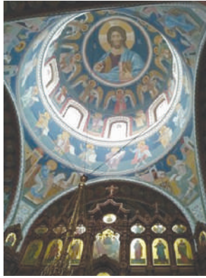
Росписи купола Нижегородского Кафедрального собора

Прибыв в Нижний Новгород, нам первым делом показали Кафедральный собор в честь святого благоверного князя Александра Невского. Этот собор считается самым высоким в городе и третьим по высоте в России. Войдя в здание собора, сразу видишь необычайной красоты иконостас, а, подняв голову – расписанный ликами святых купол. Этот храм – самый красивый, что я когда-либо видела! Рядом с храмом стоит памятник святому благоверному князю Александру Невскому.