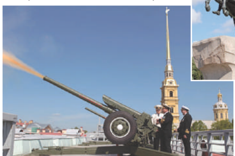
Сигнальное орудие Петропавловской крепости

На новогодних каникулах я с классом посетил культурную столицу России - город Санкт-Петербург. В составе нашей группы были ребята из других классов нашей и соседней школы. Мы побывали на знаменитой Сенатской площади, осмотрели знаменитого «Медного всадника» - памятник основателю города Петру Первому, побывали в Петропавловской Крепости на Заячьем острове. Ежедневно со стен крепости производится выстрел из сигнальной пушки,