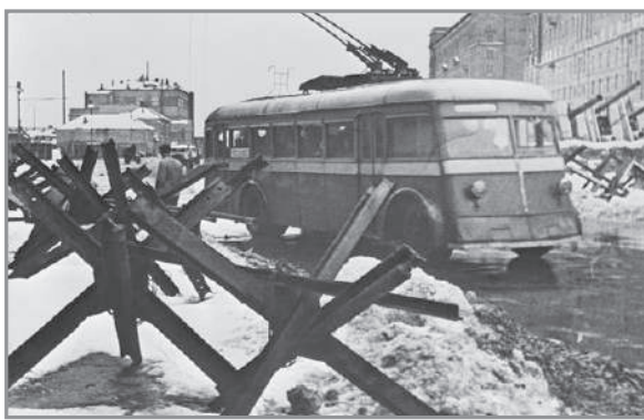
Баррикады на улицах Москвы

Битва под Москвой продолжалась в общей сложности 203 дня и ночи на огромном пространстве,