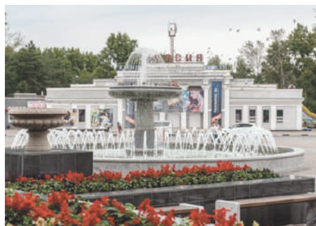
Курортный бульвар в Кисловодске

Кисловодск находится на юго-западе Ставропольского края. Здесь очень красивая природа, горный ландшафт. Горы окружают город и в нем совершенно особый микроклимат. Город очень-очень красив, зелёный, в нём много скверов и цветников. Здесь есть горячие источники, которые имеют свойство омоложения и множество минеральных источников целебной воды