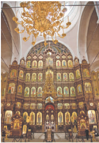
Иконостас Нижегородского Кафедрального собора

Мой первый опыт поездки на дальние расстояния без семьи – поездка на экскурсию в город Нижний Новгород вместе с моим классом. Я очень волновалась перед поездкой, но, когда присоединилась к одноклассникам, поняла, что мне нет повода переживать, все пройдет на отлично!