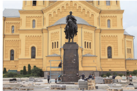
Собор Александра Невского (Новоярмарочный)

Следующей остановкой для нас стала канатная дорога. Чтобы попасть на нее пришлось дожидаться своей очереди. Так как данный «аттракцион» стоит совсем недорого, эту канатную дорогу местные жители используют в качестве общественного транспорта, чтобы добраться из дома на работу и