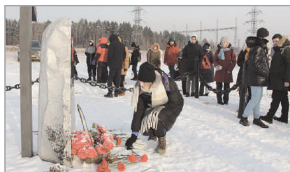
Памятник у села Рождествено, где началось контрнаступление в декабре 1941 года

Участники марш-броска посетили и братскую могилу двенадцати неизвестных солдат, почтили память наших защитников возложением цветов и минутой молчания.