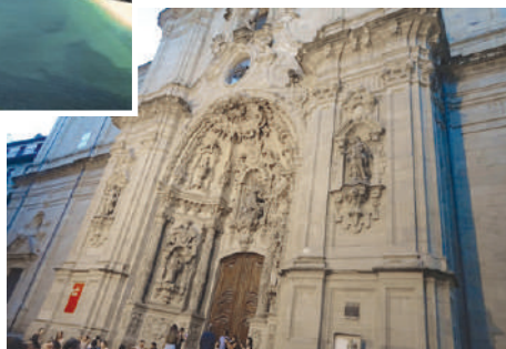
Базлика Санта-Мария-дель-Коро, г. Сан-Себастьян

Зашли мы, конечно, и в Аквариум Сан-Себастьяна, который находится неподалеку. Он совмещен с морским музеем и расположен у подножья горы Ургуль, рядом с рыболовецким портом. Здание занимает два этажа.