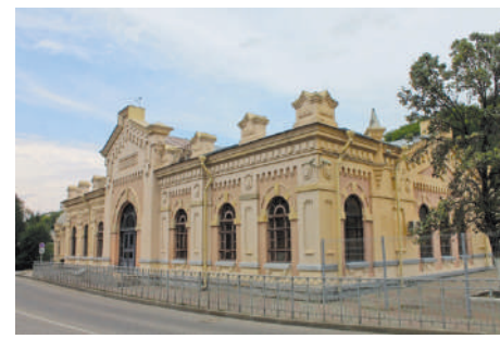
Железнодорожный вокзал в Кисловодске

и знаменитой лечебной углекислой воды «Нарзан», Своё название город и получил из-за этого.