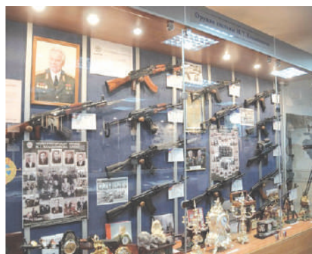
Музейно-выставочный комплекс стрелкового оружия имени М.Т. Калашникова

Музей располагается в здании Арсенала Ижевского оружейного завода, памятнике промышленной архитектуры XIX века.