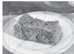
Блокадные 125 грамм

Предполагается окружить город тесным кольцом, и путем обстрела из артиллерии всех калибров и непрерывной бомбежки