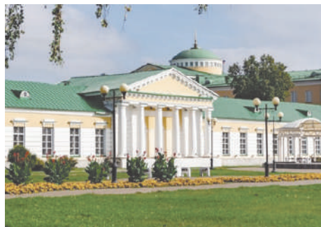
Национальный музей Республики Удмуртия имени Кузёбая Герда

(Прим. ред. - Википедия. Удмуртская Республика - субъект Российской Федерации, Входит в состав Приволжского федерального округа, является частью Уральского экономического района. Столица - город Ижевск.), крупный промышленный, торговый, научно-образовательный и культурный центр Поволжья и Предуралья, двадцать первый по численности населения город Российской Федерации. Знаменит оборонным и машиностроительным произ-