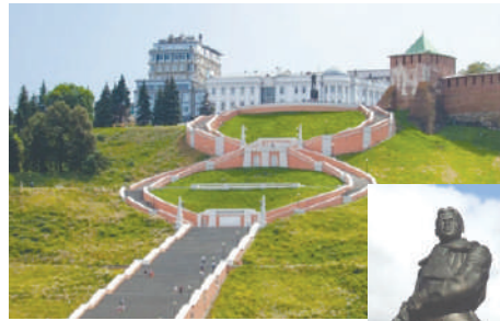
Чкаловская лестница в Нижнем Новгороде и памятник Валерию Чкалову

Этот монумент и дал название самой лестнице. Еще одна тайна связана с той самой «восьмеркой», в форме которой построена лестница. Многие историки уверены, что она представляет собой знак бесконечности. Однако истинное объяснение куда сложнее и связано со Сталинградской битвой. Двумя полукольцами фашистские войска окружали Сталинград, а