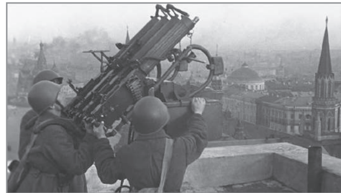
Орудие ПВО на крыше гостиницы «Москва»

Штыки от стужи побелели, Снега мерцали синевой. Мы, в первый раз надев шинели, Сурово бились под Москвой. Безусые, почти что дети, Мы знали в яростный тот год, Что вместо нас никто на свете За этот город не умрёт.