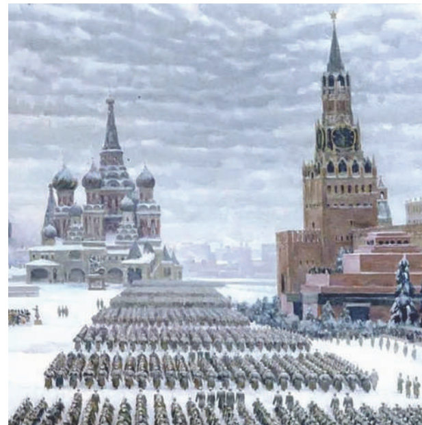
Праздничный парад 7 ноября 1941 года на Красной площади. Художник Константин Юон

Первоначальный план Гитлера предполагал взятие Москвы в течение первых трёх или четырёх месяцев. Однако, несмотря на успехи фашистской Германии в июле и августе 1941 года, усилившееся сопротивление советских войск помешало его выполнению.