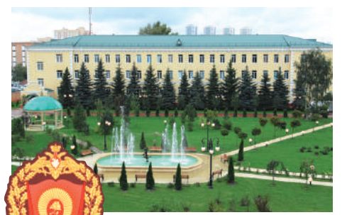
Пансион воспитанниц Министерства обороны РФ

Учебная деятельность осуществляется на русском языке, выстроена с использованием передового российского и мирового опыта. Программа обучения включает помимо предметов обязательной школьной программы широкий блок дополнительного образования.