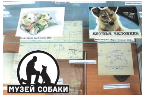
Экспозиция музея собаки

Я с удовольствием прослушал рассказ экскурсовода про разные породы собак, про собак-поводырей, про невероятную помощь собак в военное время, в освоение человеком Севера и даже... в изучение космоса. Шесть тематических залов расскажут о разных периодах российской истории, когда жизни человека и собаки были неотделимы друг от друга. Очень советую посетить «Музей Собаки», единственный в России. Этот музей откроет вам дверь в историю дружбы человека и его самого верного друга - собаки!