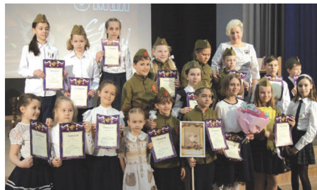
Победители конкурса стихов собственного сочинения в школе № 1317

В зале царил необыкновенно теплая, дружеская и, вместе с тем, торжественная обстановка и дух тесной взаимосвязи поколений.