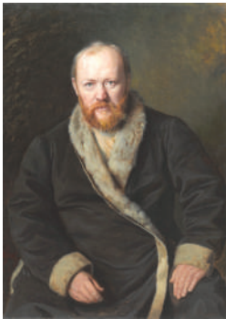
Портрет А.Н. Островского, художник В.Г. Перов

Я давно не был на основной сцене Малого театра, меня поразила технологичность сцены, как она вращалась, как мгновенно менялись декорации! Когда герои доигрывали сцену, они замирали и не двигались, пока не «растворялись» за кулисами. Над сценой на тросах находились мультимедийные экраны, оформленные в виде картин. На экран выводились исторические факты, старинные афиши, фотографии артистов,