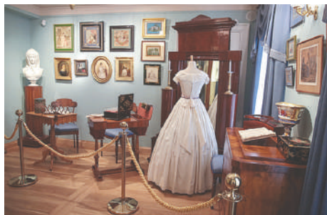
Экспозиция музея И.С. Тургенева

Следующим моим посещением стал дом-музей И. С. Тургенева , расположенный по адресу Остоженка, 37. Здесь с 1840 по 1850 год жила Варвара Петровна Тургенева, мать великого русского писателя. Это единственный в Москве музей, посвященный жизни и творчеству знаменитого русского писателя. Иван Сергеевич часто гостил у матери на Остоженке и описал в повести «Муму» происходившие здесь события. Прототипами персонажей тургеньевского произведения стали реальные лица, жившие в доме «барыни» – Варвары Петровны. Мне понравилась теплая атмосфера этого дома! Было приятно бродить по уютным комнатам и парадным залам, в которых отражена жизнь великого писателя.