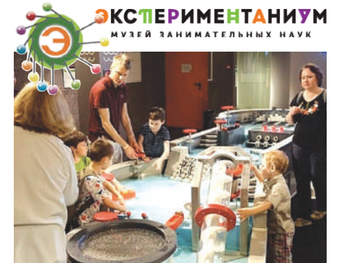
Одна из экспозиций музея

Музей закрыт: по понедельникам, в последнюю пятницу каждого месяца.)