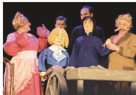
Сцена из спектакля по поэме Н.В. Гоголя «Мертвые души»