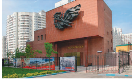
Музей Героев Советского Союза и героев России

(Прим. ред. - 117218, Москва, ул. Большая Черёмушкинская, д. 24, кор. 3. Проезд до станций метро «Академическая», «Университет» или «Крымская»; тел.: +7 (499) 744 3025.