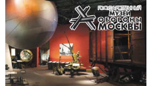
Экспозиция музея обороны Москвы

Государственный музей обороны Москвы . Этот музей необходимо посетить всем! Здесь можно узнать о важных фактах тяжелейшего периода в истории нашей страны и нашего города во время Великой Отечественной войны 1941-1945. Я увидел военную технику, аэропланы, макеты немецких бомбардировщиков, своими руками потрогал подлинный вагон-теплушку.