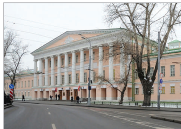
Реконструированный комплекс Ново-Екатерининской больницы, где размещается Мосгордума