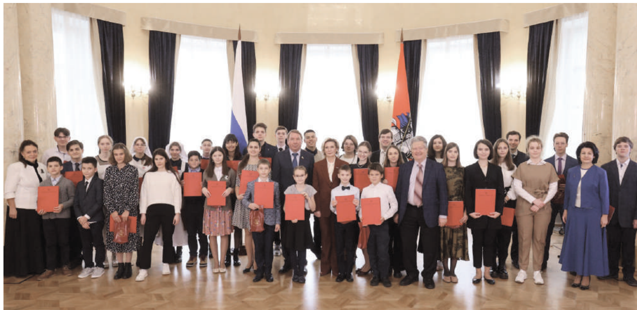
Учащиеся города Москвы - победители Шестой Всероссийской школы-конкурса «Портрет твоего края»