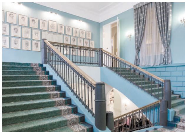
Парадная лестница. На стене галерея портретов председателей Городской думы разного времени