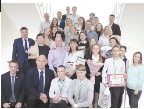
Сенатор Александр Карелин с учащимися-победителями Всероссийской детской творческой школы-конкурса «Портрет твоего края»

Победителям и их наставникам были вручены благодарственные письма и памятные подарки сенатора Совета Феде-