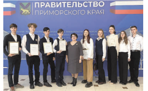
Учащиеся-победители Всероссийской детской творческой школы-конкурса «Портрет твоего края» и сенатор от Приморского края Людмила Талабаева

«Участие в таких конкурсах, размышления о судьбах страны и своей малой родине помогают формировать у подрастающего поколения правильные жизненные ориентиры», — сказала сенатор.