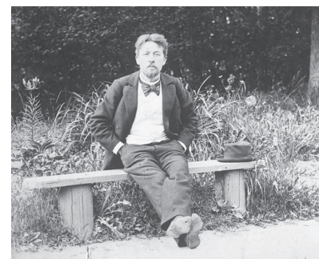
Антон Павлович Чехов в своей усадьбе «Мелихово»

Здесь, в коридоре, он организовал маленький медпункт. Когда Чехов вёл приём больных, над флигелем поднимали вверх флажок из красной ткани. Это означало, что приём начался. Дальше - две комнаты: маленькая спальня, где писатель иногда ночевал, и второй кабинет. В нём стоит подлинный стол Антона Павловича, за которым он работал. За этим столом писателем были написаны знаменитые на весь мир произведения: «Палата №6», «О любви», «Крыжовник», «Дом с мезонином», «Бабы» и пьеса «Чайка».