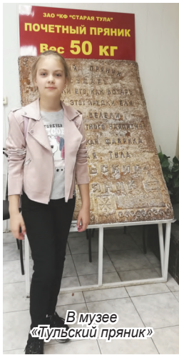
В музее «Тулский пряник»

Сегодня город Тула – это современный город с островками старины. К сожалению, нам не удалось в этой поездке посетить все исторические места в городе, которые хотелось бы увидеть. Будет повод вернуться... Чего и Вам желаю! Обязательно приезжайте полюбоваться этим замечательным русским старинным пряничным городом!