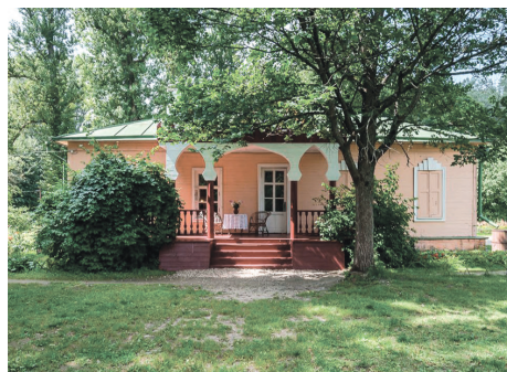
Главный дом усадьбы «Мелихово»

Второй раз мы приехали в Мелихово, когда мне было десять лет. В тот год в главном доме усадьбы шли реставрационные работы, но это не помешало нам получить удовольствие