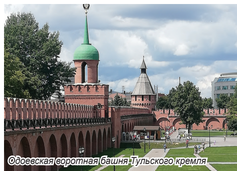
Одоевская воротная башня Тульского кремля

Тулский кремль имеет форму прямоугольника. Внутри кремля – два собора, в одном из них сейчас размещен музей тульского оружия. В крепостной стене – девять башен, четыре из них – проездные. Угловые башни крепости играли огромную оборонную роль. Из них вели обстрел нападавшего врага, поэтому в угловых башнях много бойниц.