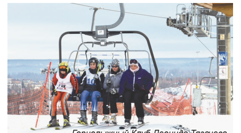
Горнолыжный клуб Леонида Тягачева

трасс: две зеленые, две синие, три красные и две черные. Их общая протяженность — 3 689 метров. Это место подходит для всех: и для новичков, и для опытных лыжников. Этот клуб является традиционной тренировочной базой сборных России по горным лыжам и сноуборду. На его склонах начинали свою спортивную карьеру многие знаменитые российские горнолыжники. На базе клуба проводят мастер-классы по горным лыжам и сноуборду, спортивные праздники, работает детская школа.