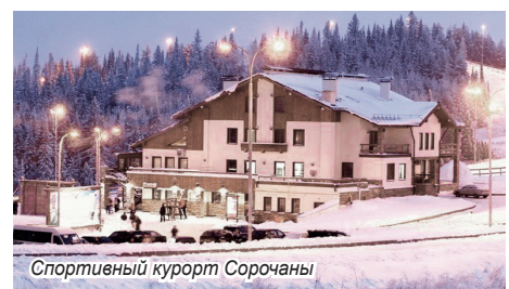
Спортивный курорт Сорочаны

1. Спортивный курорт «Сорочаны», Курово, Дмитровский район. Это самый популярный горнолыжный курорт, расположенный недалеко от Москвы. Даже если вы совсем не опытные лыжники, сюда можно приехать всего на один день, с мамой и папой. Чёрные трассы не советуем брать новичкам, они, явно, для тех, кто уже уверенно стоит на лыжах. Совет от нас: если вы только учитесь вставать на лыжи и сноуборд, у стойки администрации закажите занятие с инструктором.