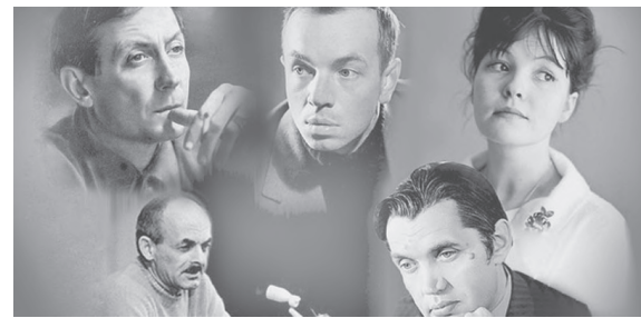
Эпоха «шестидесятников» (слева направо) Евгений Евтушенко, Булат Окуджава, Андрей Вознесенский, Роберт Рождественский, Белла Ахмадулина

Короткий период оттепели изменил буквально всё.