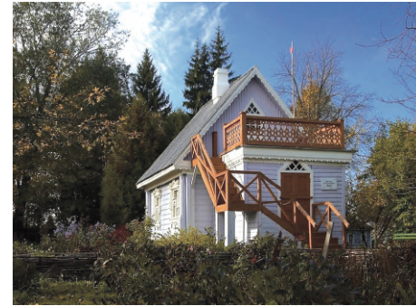
Флигель, где была написана «Чайка»