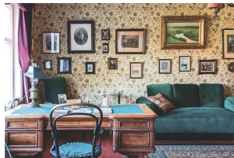
Кабинет А.П. Чехова в Мелихово

Антон Павлович сажал деревья, кусты. Чехов очень любил розы, но не любил георгины. У Чеховых в саду были такие растения, которых не было даже в Ботаническом саду Ялты. До сих пор на территории усадьбы растут два тополя посаженные писателем. Сам Чехов утверждал, что мог бы стать хорошим садовником. Антон Павлович очень много физически работал и, конечно же, уставал. Он об этом написал: «...меня всего ломало от физического труда, теперь уже ничего, привык, мышцы мои крепнут с каждым часом, я становлюсь сильнее, так что, если вдруг моё имя будет продано с аукциона, то я устроюсь атлетом в цирк...». Чехов, вспоминая как врачи говорили ему, что нужно уехать в деревню подальше от забот, с иронией впоследствии напишет: