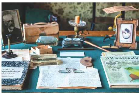
Рабочий стол писателя