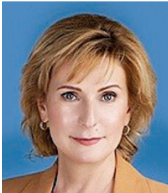
Инна Юрьевна Святенко Председатель Комитета Совета Федерации по социальной политике, представитель в СФ от законодательного органа государственной власти города Москвы

и родителям за огромную воспитательную работу, проводимую с детьми.