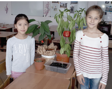
Показываем наши посадки классу (перец)

- Загрязнение атмосферы. В каждой стране есть промышленные предприятия, которые отравляют воздух, выхлопные газы от транспорта.