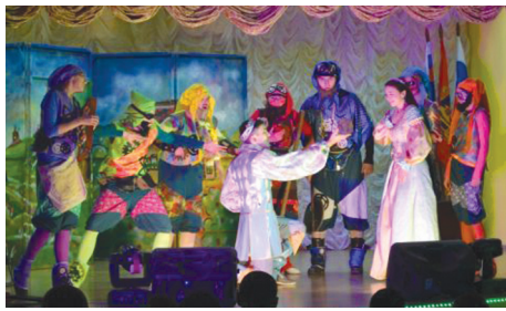
Сцена из спектакля «Белоснежка и семь гномов»